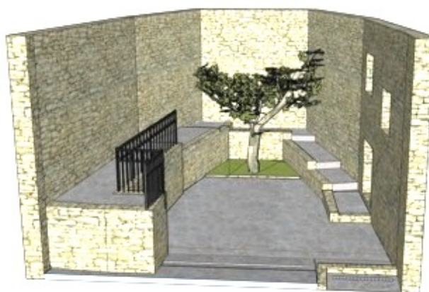
Situation après le Chantier 2023